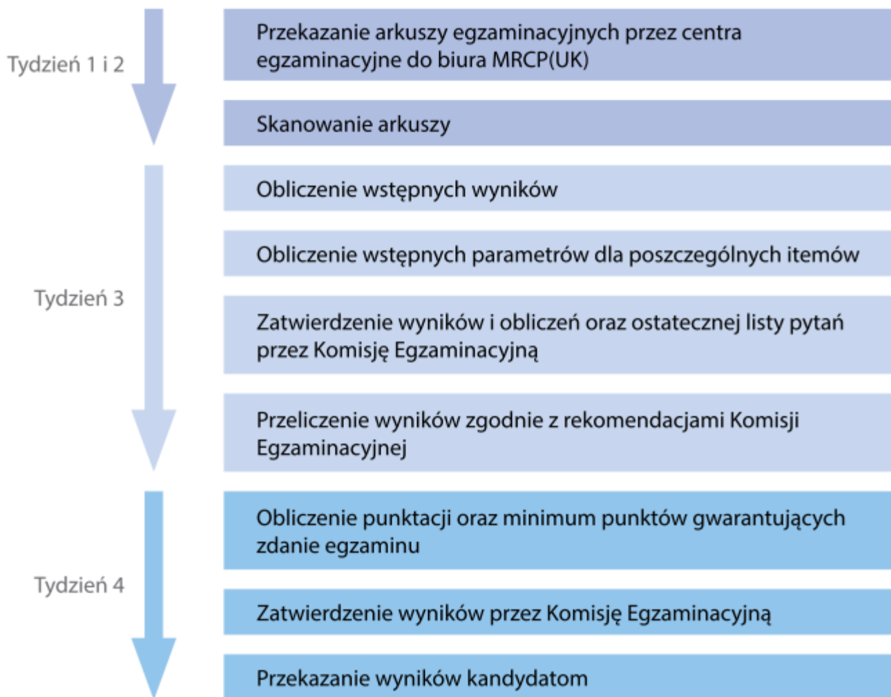
Rysunek 2. Proces obliczania wyników części I i II MRCP(UK)